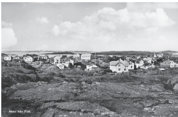
Figur 1 Fotö. Vinga i bakgrunden.

Kronologisk rekonstruktion, minut för minut, timme för timme, utifrån olika vittnesmål: