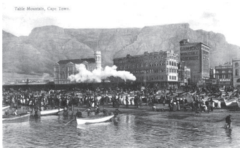
Figur 6 Hamnen i Kapstaden som den kan ha sett ut i början av 1900-talet. Taffelberget i bakgrunden. Kommer röken från ett ånglok?