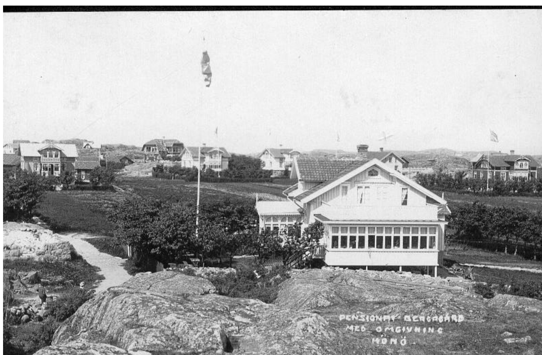
Pensionat Bergagård. Idag har detta hus adressen Gårdastigen 5