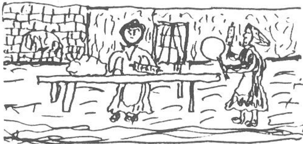
Sôffis Bage stöva

- Ja, ja, en ä la inte tafatt precis. Ja sädder på kel, så ja får meg en dröbe vaart också.