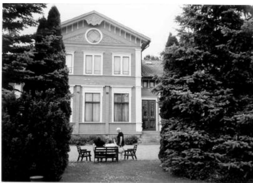
Här på Gamla Tingshuset i Moholm åt vi lunch

intressant plats även om det inte fanns så mycket kvar sedan Arns dagar. Men med fantasins hjälp kunde man föreställa sig hur det kunde ha sett ut förr. Den dagen var det marknad i Forsvik, så det blev några besök vid stånden också. Färden gick vidare till Billingen där vi fick kaffe på SMU-gården. Vid 19-tiden var vi tillbaka i Falköping där guiden lämnade oss efter att ha underhållit oss hela dagen på ett skickligt och intressant sätt. Vi hoppas att det blir fler resor i Arns fotspår.