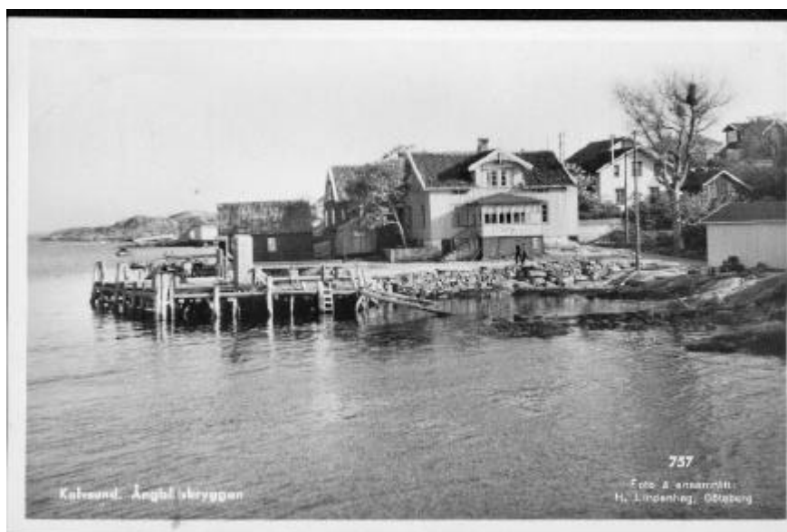
Ångbåtsbryggan på Kalvsund