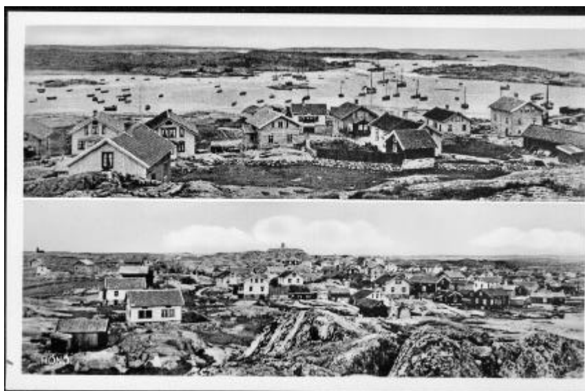
Hönö ur Åke Hanssons vykortssamling

Hönö har också en dyster historia. Närheten till öppna hav och alltför små och öppna båtar orsakade före sekelskiftet många drunkningsolyckor. Också andra världskriget slog hårt mot ön, kanske värre än mot andra fiskaresamhällen. Men tillvaron går vidare och tiderna förändras också här. Från tiden vi minns då fälten låg öppna mellan byarna och boskapen betade bort allt utom slån och nyponbuskar, ligger nu bebyggelsen tät över ön. Utom där vi har trivsamma strövområden. Den skogliknande växtligheten och alla prydligt beväxta trädgårdar gör att Hönö är en vacker ö. Fina vägar och ett hälsosamt lagom avstånd till fastlandet förhöjer trevnaden. Kommer därtill att den befolkning som kommit från fastlandet och bosatt sig har blivit riktiga Hönöbor. Det gör att vi har anledning att vara belåtna och trivas på vår ö.