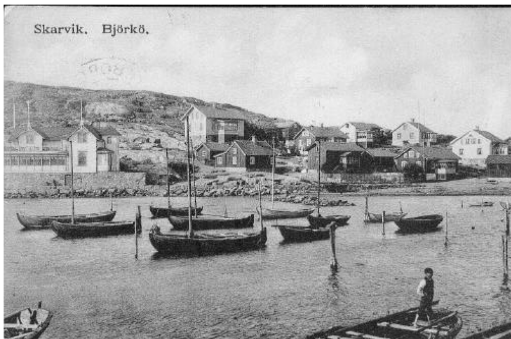
Skarvik, Björkö (ur Åke Hanssons vykortssamling)