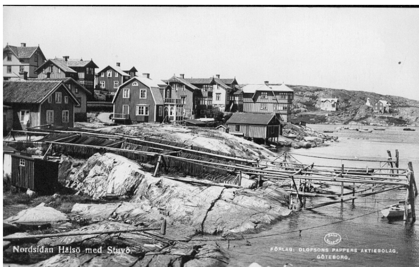
Vykort utlånat av Åke Hansson