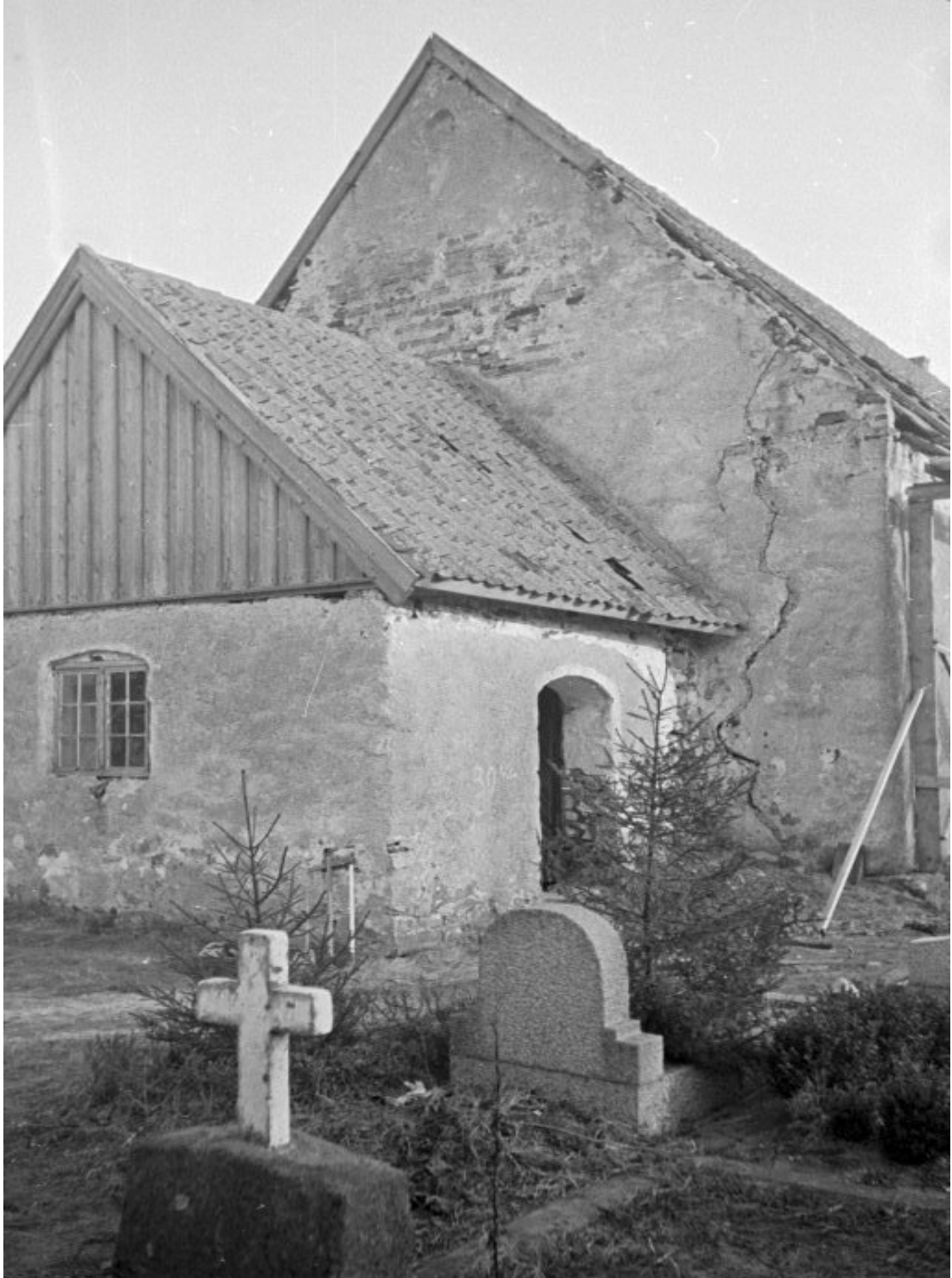
Öckerö gamla kyrka. Bilden tagen av Bertil Berthelsson 1939 Bilden kommer från Riksantikvarieämbetet, ATA: www.raa.se/kmb Se även på sidan: www.raa.se/arkiv/index.asp

Medlemstidning för Öckerööarnas Släktforskarförening Nr 1 2006 Årg 8