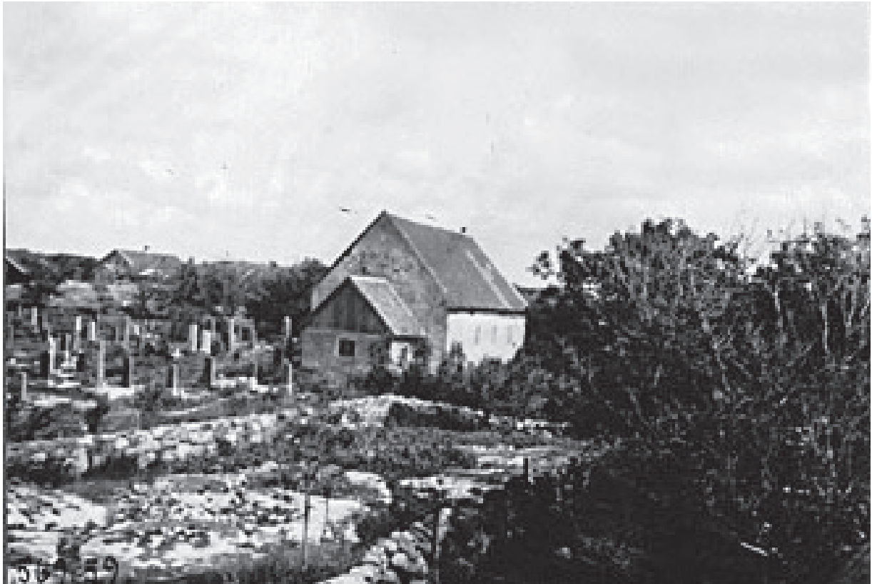
Öckerö gamla kyrka 1923

Glöm nu inte att skicka in era bidrag till nästa tidning, manusstopp 30 mars