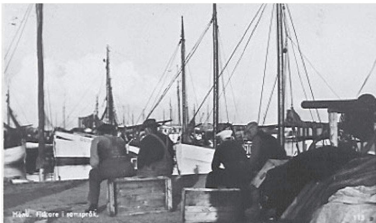
Fiskare i samspråk nere i Klåva hamn