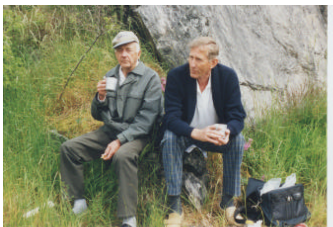
Här kopplar våra Heden-guider av med en väl unnad fika.