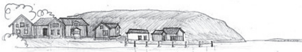
”Sunnebacken eller Bovik eller rättare Nolö”

Barn i andra giftet: Medtas inte här: se ovan