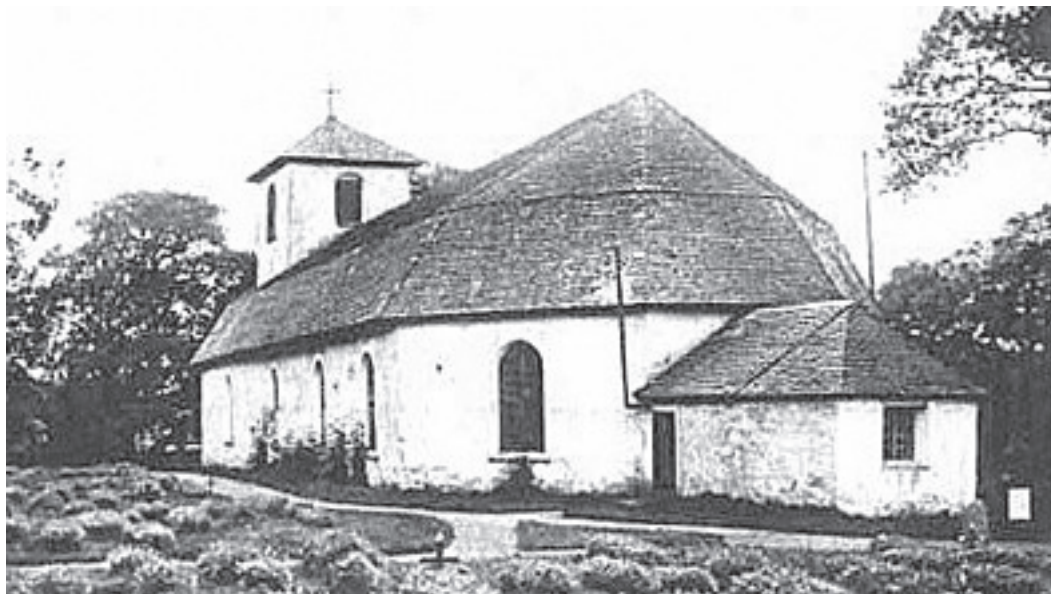
Västra Tunhems kyrka i äldre tid