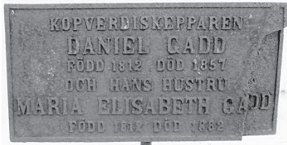
Graven finns på Lundby gamla kyrkogård