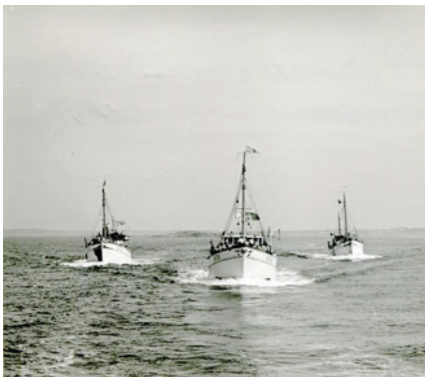
Hönöbåtarna Granö, Kennedy o Carina på väg till Vinga med konferensbesökare 1960-tal