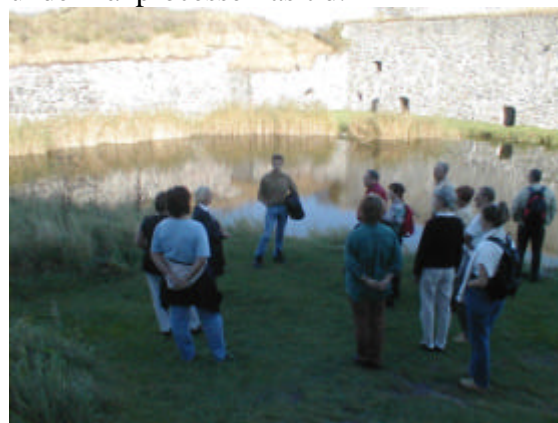
Här står vi vid dammen

Bland de många händelser som guiden berättade, och som fastnat i minnet, är vad "Dammen", som ligger på yttre borggården, har använts till. Före 1580 försåg den borgens besättning och husdjur med färskvatten. Men den användes också under häxprocessernas tid.