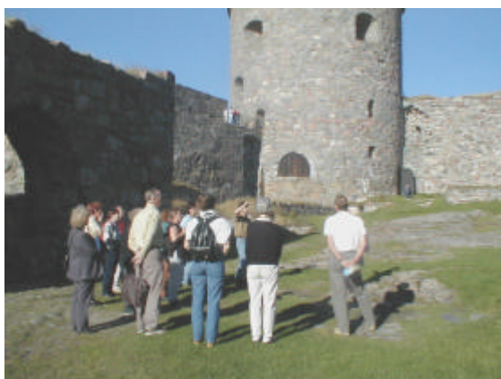
Här ser ni oss nedanför Fars Hatt

Den guidade utflykten till Bohus fästning och Ragnhildsholmen blev ett lyckat besök i strålände solsken. Ett femtontal medlemmar ställde upp. Den kvinnliga guiden var med oss på båda platserna. Hon var verkligen kunnig, och berättade allt som var värt att veta om dessa gamla ruiner.