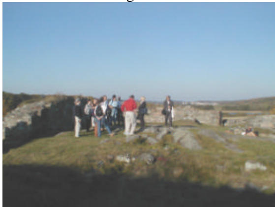
Hela gänget mitt inne i borgen

Efter denna rundvandring fortsatte färden till Ragnhildsholmen . Denna slottsruin ligger några kilometer från Kungälv vid Nordre Älv. Här lät Håkon Håkonsson anlägga ett slott i mitten av 1200-talet. På andra sidan älven låg den norska staden