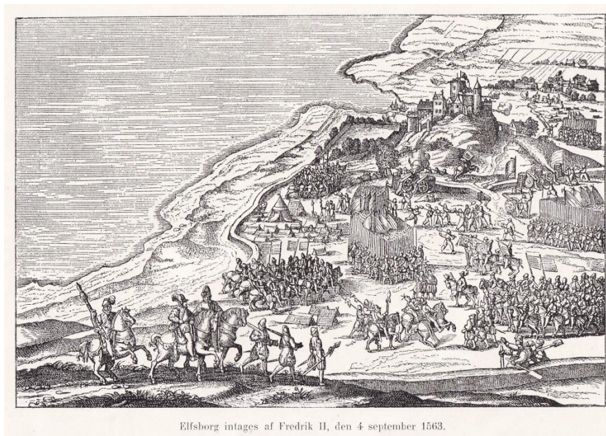
Älvsborg intages af Fredrik II, den 4 september 1563.