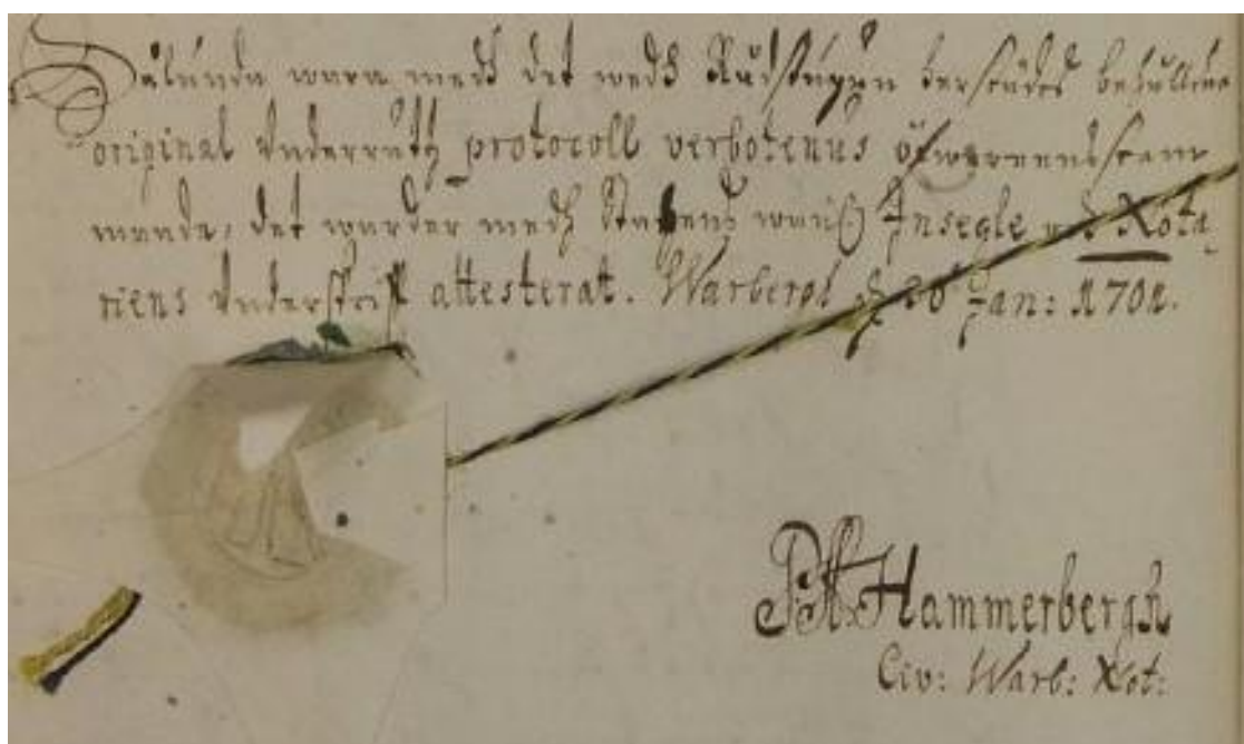
Figur 2: Hammarbergs (P. A. Hammarbergh, Civ: Warb: Not: [Civitas Warbergensis Notarie=staden Varbergs notarie]) vackert präntade namnteckning efter kämnärrättens protokoll 1701 30/1 (renovatet som sedan skickades till Göta hovrätt). Han intygade med stadens vanliga sigill och sin underskrift att han gjort en riktig avskrift av originalet.