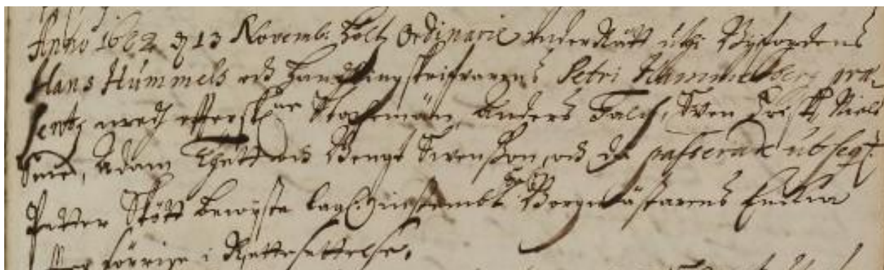
Figur 1: Petrus (här gen. Petri) Hammarberg var tingskrivare vid kämnärrättens sammanträde 1682 13/11.