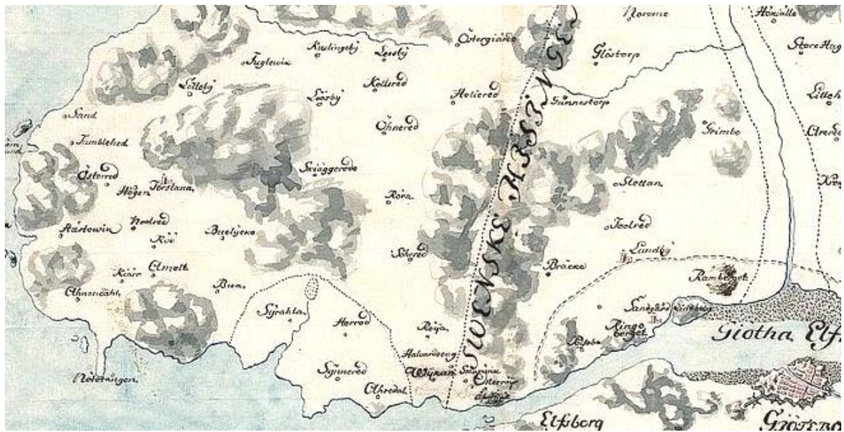
Utsnitt ur svensk militär karta över Hisingen 1645. Alla gränser och avstånd stämmer inte, men man ser hur Lundby och Tuve med sin enklav med Syrhåla m.fl. gårdar ligger i förhållande till Björlanda och Torslanda. Viken betonad med fetstil. Bur har inte kommit med, kanske för att namnen skrevs likadant då. Särskilt Bulycke ses nära Noleröd.